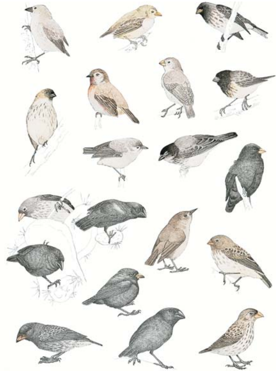
Carles Fuchs © 2008

Finalment, l'anàlisi del DNA demostra que les catorze espècies de pinsans de les Galápagos han evolucionat a partir d'un ancestre comú que va arribar a les illes fa entre dos i tres milions d'anys.