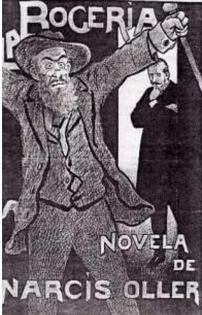
Litografia de Mariano Foix per a l'anunci de la novel·la a L'Esquella de la Torratxa .

siècle—, que no només afecta els patrons estètics vigents (l'incipient Modernisme es